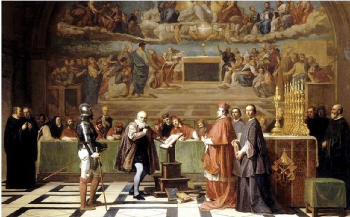
Galilée devant le Saint-Office en 1632 J. Nicolas, huile sur toile, Musée du Louvre

The majority of teachers believe that the peer review method is more relevant than course assessment by students